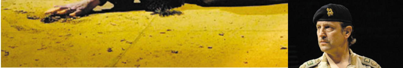
مشاهد من مسرحية (نساء طرودة)

كربون: ان اسمح لك ان تكون لك ذلك التفرقة الكبير الذي وجهه له ابنة زوجا... انها... ووجهته له الحققة مما زاده حقا واستبنا. إن هذا الصراع بين الشخصيات هو شيء متعارف عليه في النخب الكلاسيكي خاصة عند شاعر عظيم مثل سوفوكليس، وهو شيء متعارف عليه في مرحلة الرومانسية أيضا.