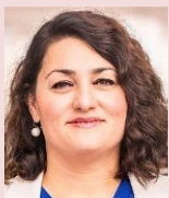
Lamyia Kaddor, MdB, Bündnis 90/Die Grünen

Lamyia Kaddor, Bundestagsabgeordnete der Grünen und Mitglied im DAFG-Vorstand, unternahm kürzlich eine Reise durch das Land, die sie von Damaskus über Aleppo bis nach Idlib führte. Vor Ort sprach sie mit zahlreichen Akteur*innen und sammelte vielfältige Eindrücke. Diese Erfahrungen teilt sie nun im Rahmen der Reihe „Politik im Dialog“, zu der die DAFG e.V. herzlich einlädt. Anschließend bietet eine offene Diskussion die Gelegenheit, die aktuelle Lage und Zukunft Syriens sowie die potenzielle Rolle Deutschlands in der laufenden Transformationsphase zu erörtern.